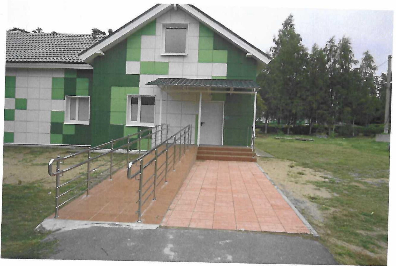
Вход в помещение раздевалки бани